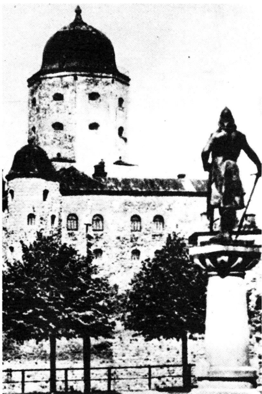
Kuva 2. Torkkeli Knutinpoojan patsas ja Viipurin linna.