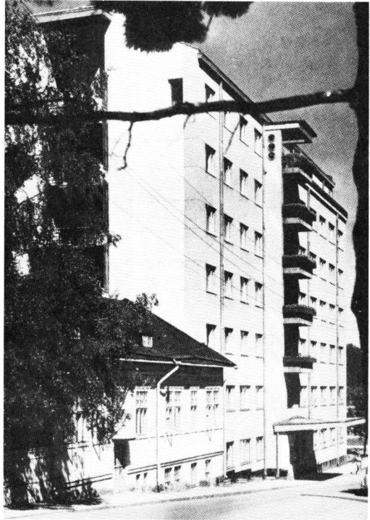
Kuva 6. Lahden Diakonissalaitos 1951. Sairaansijoja 124, joista puolet silmäpotilaille.

keskussairaalassa Helsinkiä lukuun ottamatta.