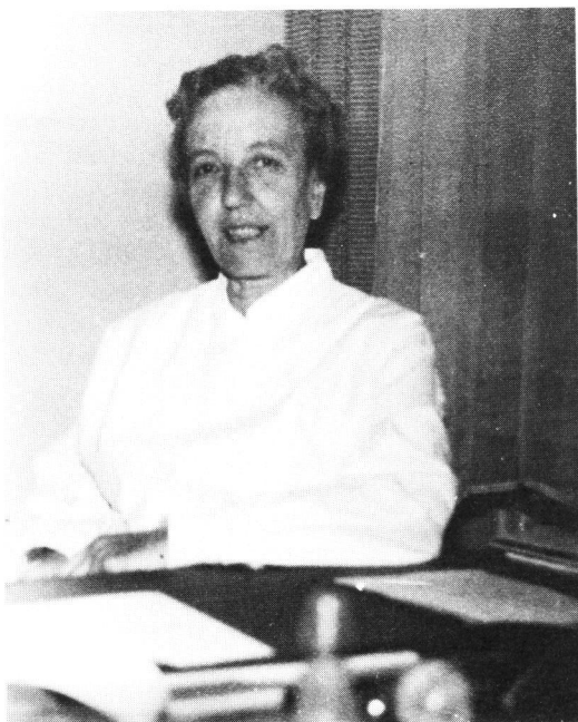
Kuva 5. Ylilääkäri Signe Löfgren 1930-luvulla.

Käytännön silmähoitoa tehostamaan professori Löfgren kirjoitti ansiokkaan Silmätautiopin oppikirjan sairaanhoitajille, joka oli laajalti käytössä vuosikymmeniä.