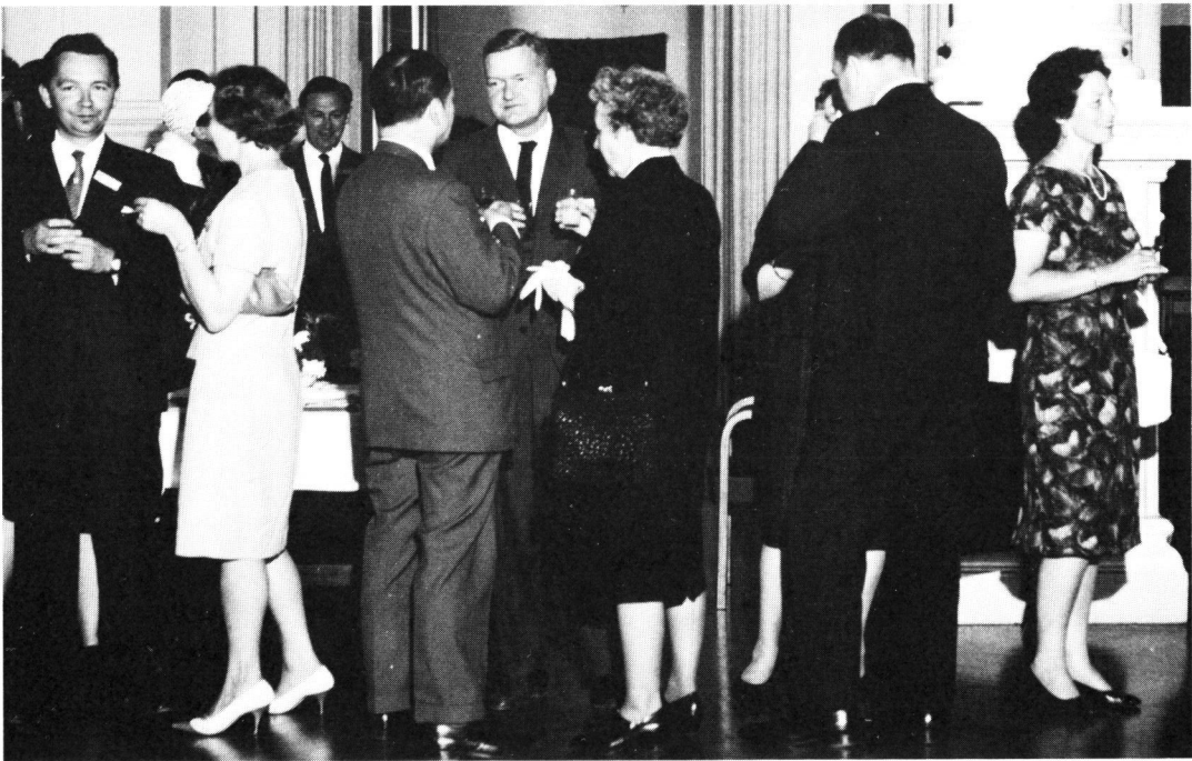
Kuva 9. XVI Pohjoismaisen Silmä lääkärikongressin osanottajia Helsingissä kesäkuussa 1963. Professori Signe Löfgren keskellä lähes selin.

Signe Löfgren osallistui ahkerasti kongresseihin (kuva 9) sekä Silmä lääkäriyhdistyksen kokouksiin ja oli vilkas puheenvuoro-