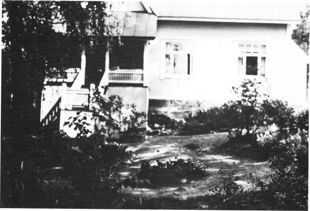
Kuva 7. Professori Signe Löfgrenin kesäasunto Salajärven rannalla Nastolassa lähellä Lahtea.

apulaislääkärinä. Tänä aikana sain seurata hänen työpäivänsä kulkua ja työskentelytapojaan. Hän aloitti yleensä työpäivänsä kahviaamiaisen jälkeen kello 8—9 ottamalla vastaan potilaitaan yksityisvastaanotolla kotonaan. Hänen sisarensa toimi vastaanottoapulaisena ja hoiti samalla myös Signen taloutta. Eräs lahtelainen potilas kertoi kerran minulle menneensä Signe Löfgrenin vastaanotolle hänen kotiinsa noin 10 minuuttia myöhässä, jolloin vastaanottoapulaisena toiminut Signen sisar kehotti potilasta poistumaan, koska oli omasta syystä myöhästynyt. Signe oli suljetun oven läpi kuullut asian, vaikka tutki parhaillaan potilasta, ja huusi kovalla äänellä, ettei pidä poistua vaan odottaa, ”koska meidän kellomme käyvät kuin lehmänkellot”.